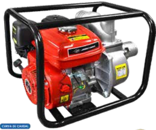
CURVA DE CAUDAL